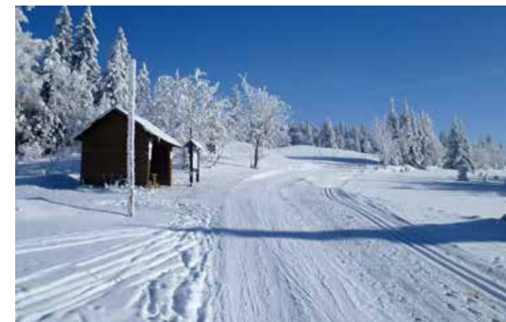
Lyžařské stopy jsou krásně upraveny a nechybí ani odpočívadla

denní etapovou jízdu „Lyžařského přejezdu Krušných hor“ z Kraslic do Chomutova. Podle zvoleného směru a odboček ujedeme každý den 35 až 40 kilometrů, po kterých nám vždy zbudou síly i na večerní posezení s přáteli. Nemusíme tedy být žádní olympionici, aby nám Krušné hory poodhalily své krásy a tajemství. A možná potkáme i Marcebilu, patronku Krušných hor. Tak si připravte k vyprávění i své příběhy ze života, pro setkání s ní i pro večerní posezení se budou hodit.