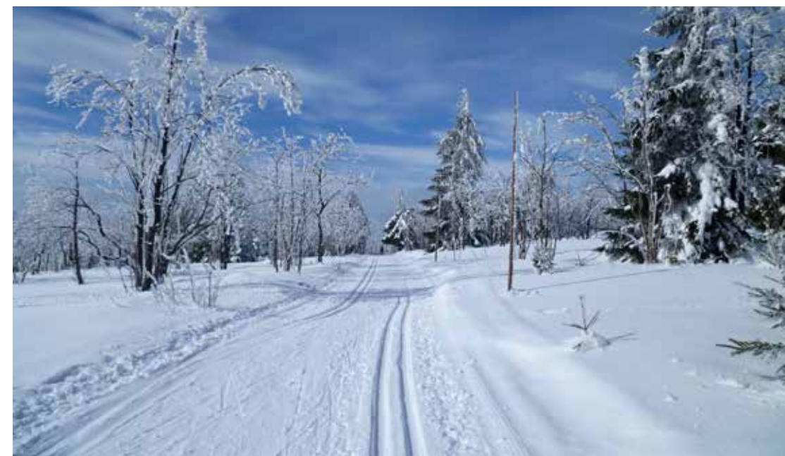
Dobrá stopa a azurová obloha, i proto se sem rádi vydáváme

Tam se také rozhodujeme, zda pokračovat vpravo po trase magistrály přes rozcestí „Za Špicákem“ a „Pláně nad Božím Darem“, nebo si přidat pár kilometrů a jet přes Myslivny. Romantika Ježíškovy cesty a bezvadný sjezd