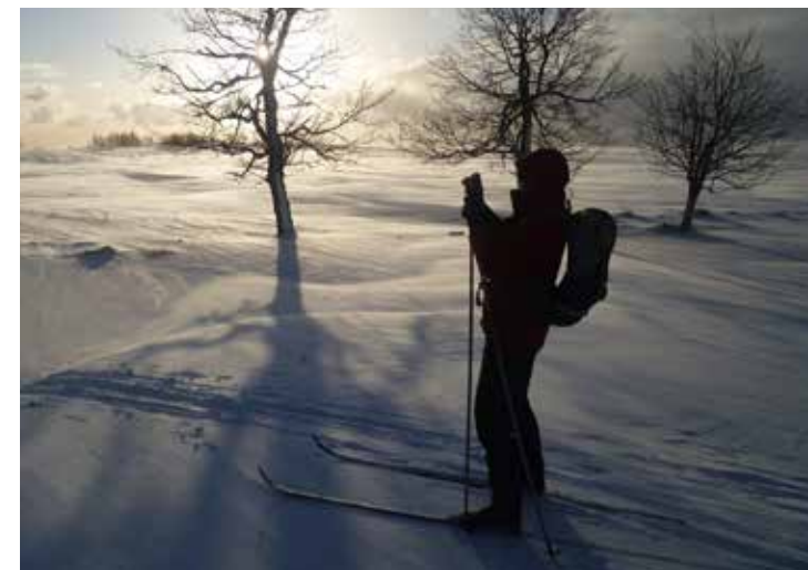
Odjezd z Měděnce při východu slunce

Z rozcestí za Předním Ostružníkem jsme se ovšem dost vezli z kopce a zima, co leze pod bundy, nás popohání po silničce do kopečka k rozcestí turistických tras „Rolava – bývalá obec“. Nespornou výhodou je, že tato