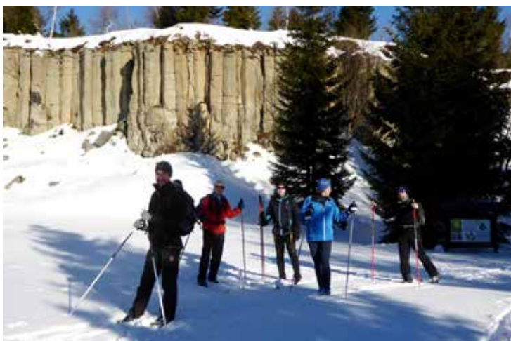
Přírodní rezervace Rýžovna

zhruba půlkilometrový úsek po silnici nebývá vždy sjízdný, sundáme tedy běžky, jdeme po svých a lyže nasadíme až pod hájovnou. Zbytek trasy na okraj Horní Blatné je technicky náročnější na dojezd a o pády do sněhu zde není nouze. Na náměstí, do tepla penzionu, už to ale není daleko, a tak ten sníh za krkem a v kalhotách je spíše legrace. Pokud neseženete ubytování v Horní Blatné, máte možnost prodloužit trasu o 7 km a přes Bludnou a Červenou jámu dojet až do Abertam. Druhý den je však dobré vrátit se na rozcestí „Červená jáma“ a pokračovat po magistrále směrem na Boží Dar.