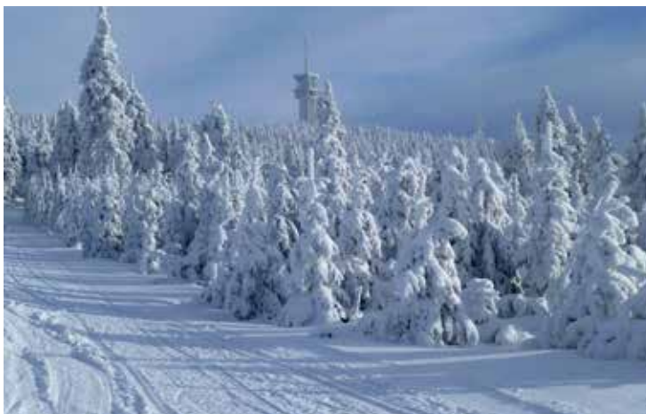
Těsně pod Klínovcem

Z rozcestí u Korce vede trasa s pěknými výhledy nejdříve pod Hraniční horu, poté na rozcestí pod Zaječím vrchem (970 m). Mírné klesání tu svádí k rychlé jízdě, ale na rozcestí pod Vlčí horou (925 m), u silnice z Horní Blatné do Nových Hamrů, jsme zase vychladlí a pozvolné stoupání k další odbočce přijde vhod. Tak jsme dojeli až na rozcestí s Schupenberskou cestou a blíží se závěr dnešní etapy. Následující