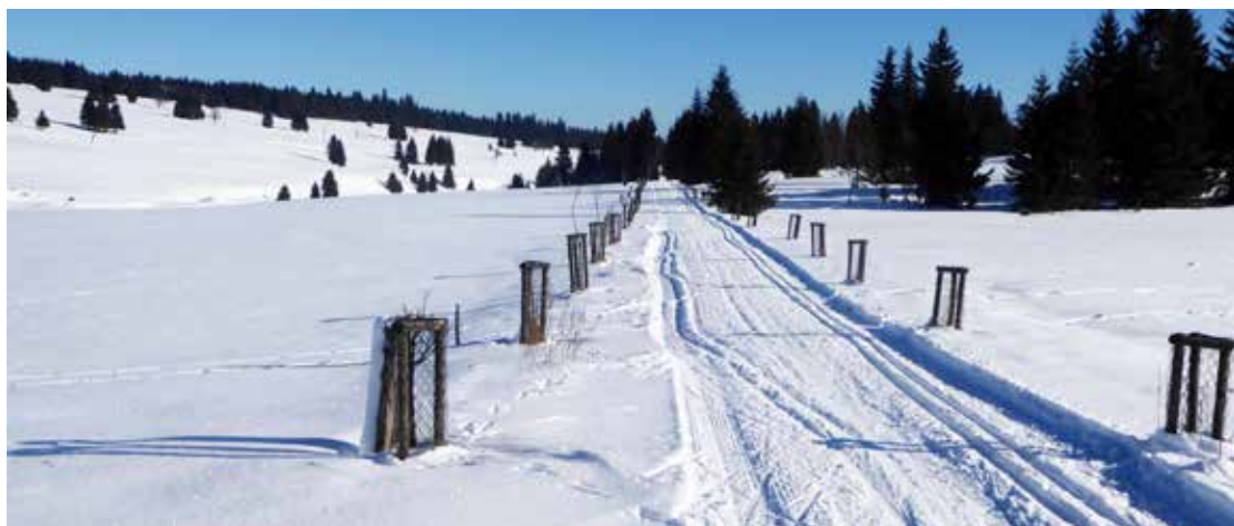
Cesta údolím Rolavy je jednoduše nádherná

k vodní nádrži Myslivny vítězí. U vodárny přeběhneme silnici a už jsme zase ve stopě kolem vrcholu Hubertky směrem na Boží Dar. Cestou potkáme přístřešky a herní prvky Ježíškovy cesty, s ohledem na počasí nás ale více zaujala bouda s občerstvením. A nejen ta. I názvy rozcestí „U Kažišuka“ nebo „Vraky“ zaujmou. Od toho druhého jsou to navíc už jen tři kilometry do Božího Daru a k dobrému obědu. Po něm nás pak čeká ještě víc jak polovina dnešní trasy do Měděnce. Kdo se nechce už v poledne plahočit dál, může si najít ubytování ve městě a úsek Horní Blatná - Měděnec tak rozdělit na dva kratší.