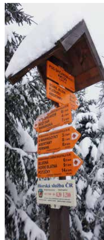
Pod Špičákem (rozc.)

zády jedeme v lehce vyšlapané stopě podél železniční trati směrem na Rusovou, a to až k dalšímu propustku pod tratí. Tady musíme odbočit kolmo doleva a sjet po loukách k silnici na rozcestí červené TZT „Rusová – zaniklá obec“. Za sebou nyní máme na orientaci nejnáročnější úsek, dál nás již povede červená turistická značka společně s vyjetou stopou většinou po zpevněných lesních cestách. Nad vodní nádrží Přísečnice oceňujeme pěkné výhledy, ale po necelých dvou kilometrech vjíždíme do lesa. Na rozcestí „Pod Jelení horou“ potkáváme žlutou TZT, my se ovšem držíme stále červené, a to až na okraj lesa před Novou Vsí u Křívova. I dále pak můžeme sledovat červenou TZT, kolem železniční zastávky dojet až do vesnice a pak