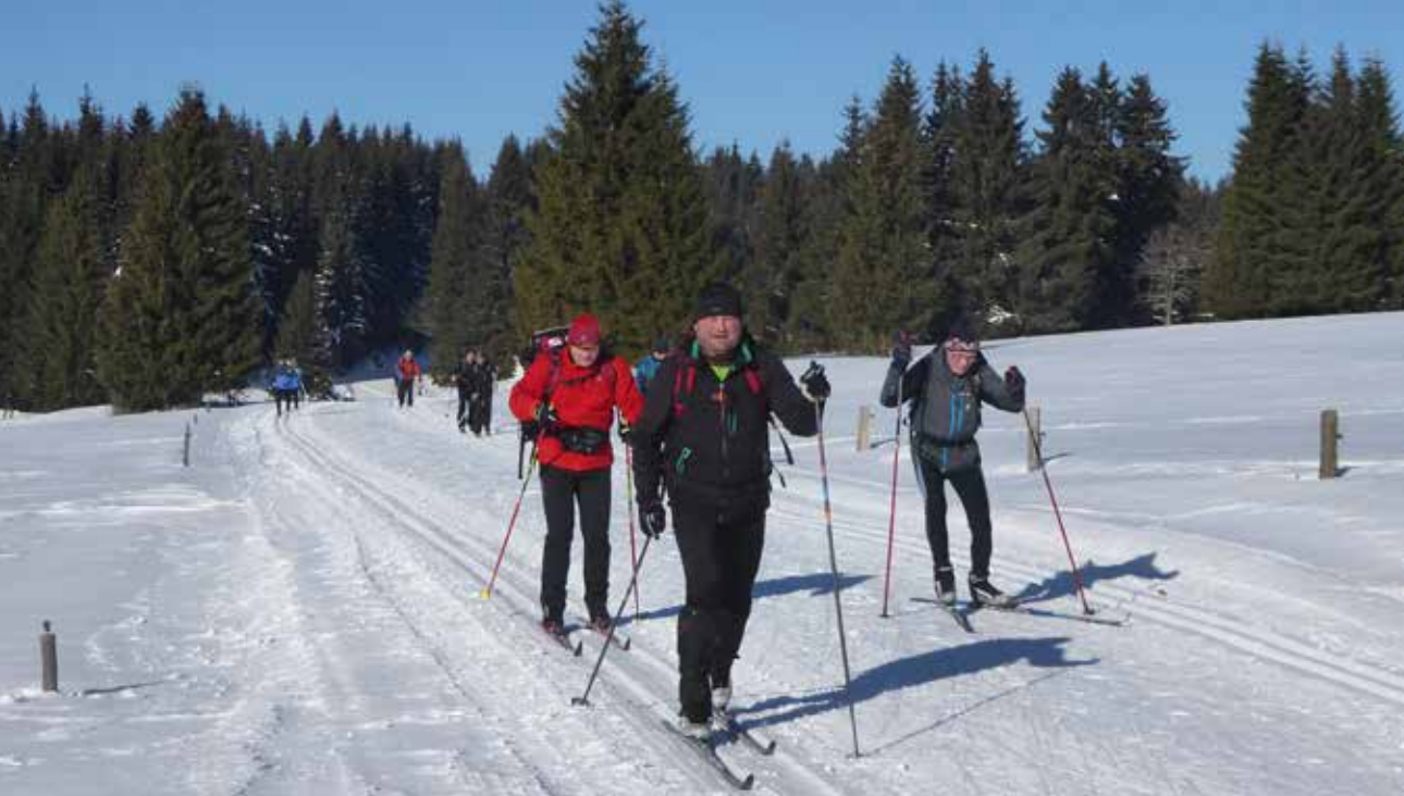
Krušnohorská lyžařská magistrála je pro běžkaře ideální