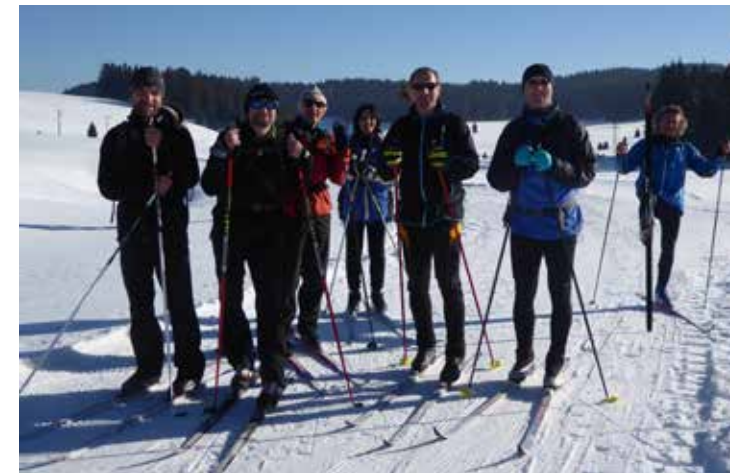
Povinná skupinová fotografie

po silnici dojet do obce Hora Svatého Šebestiána. Můžeme však také podél lesa odbočit vlevo a jet neznacenou vyjetou stopou přes pole, kde nám budou vodítkem vedení vysokého napětí a za ním větrné elektrárny. Tuto druhou variantu však doporučuji jen za dobré viditelnosti nebo když jedete s někým, kdo už cestu zná.