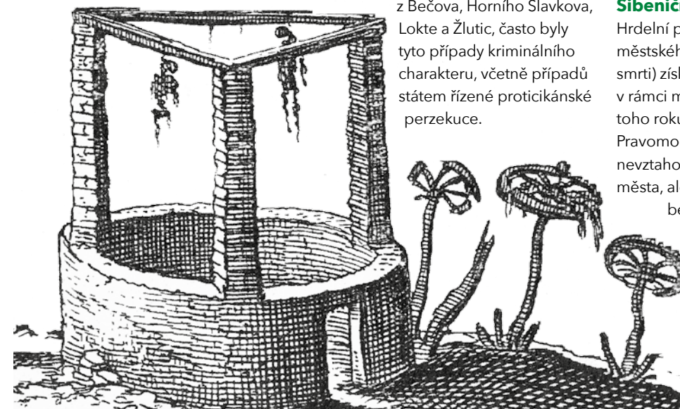
Kruhová šibenice a kola na rytině ze 17. století

Hrdelní právo (tedy právo městského soudu vynášet tresty smrti) získal Bečov roku 1399 v rámci městských výsad, které mu toho roku udělili Rýzmburkové. Pravomoc hrdelního soudu se nevztahovala pouze na obyvatele města, ale i na vesnice celého bečovského panství. Soud