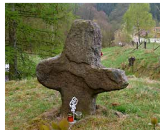
Smírčí kříž u Povodí u Milhostova na Chebsku, foto: L. Zoubek Smírčí kříže u kostela v Milhostove na Chebsku, foto: L. Zoubek

Od roku 2003 vede na Šibeniční vrch se šibenicí naučná stezka, o rok dříve byly zbytky šibenice archeologicky prozkoumány. Šlo o dosud ojedinělý výzkum tohoto typu památek u nás a o jeden z nevelkého počtu podobných v Evropě. Při výzkumu bylo nalezeno i několik kostí zde popravených odsouzců. Více se o naučné stezce dočtete v příštím TURISTOVI.