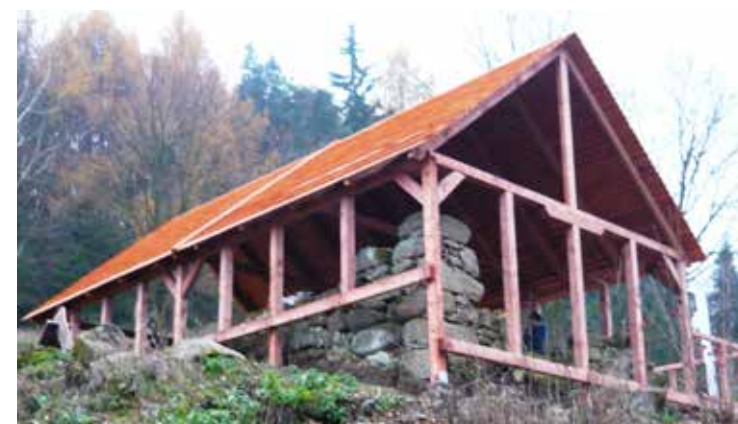
NS šibeniční vrch Becov Katovna

O šibenici patřící k městu je dosud z písemných pramenů známo jen minimum údajů. Značná část pramenů zanikla pravděpodobně za požárů města v minulosti (katastrofální byly zejména požáry v letech 1621 a 1760), a tak dnes o bečovské šibenici neznáme až na jednu výjimku žádné konkrétní historické údaje. Relikty z kamene zděné šibenice u Bečova, společně se šibenicí u Horního Slavkova jsou jedním z několika