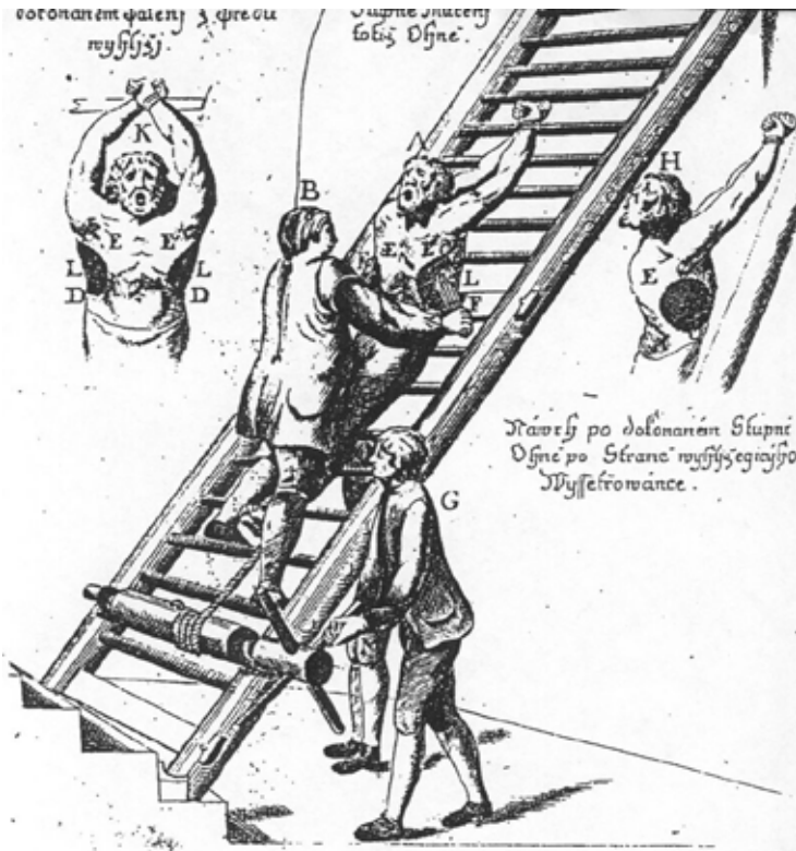
Mučící nástroj žebřík

Městská rada se scházela k pojednání svých záležitostí, tedy i k soudním jednáním, ve čtvrtek v zasedací místnosti radnice. Zasedání se zúčastnil i rychtář, kte-