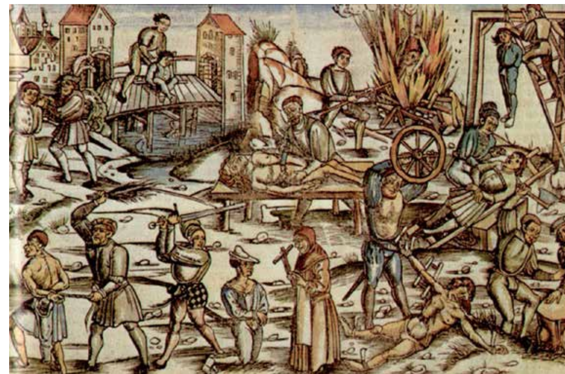
Formy hrdelních trestů na vyobrazení z počátku 16. století

smrti, se formovala zejména od vrcholného středověku, rozvoje pak dosáhla v období 16.–18. století, kdy v Českých zemích působilo 387 hrdelních soudů v královských i poddanských městech a městečkách. Chebsko (včetně Loketska) patřilo s Moravou a Slezskem k oblastem, které nejvíce a nejdéle odolávaly snaze o centralizaci soudnictví, nastolenou po roce 1548. První městské soudy na Loketsku začaly změnu respektovat až před koncem 16. stol., kdy se