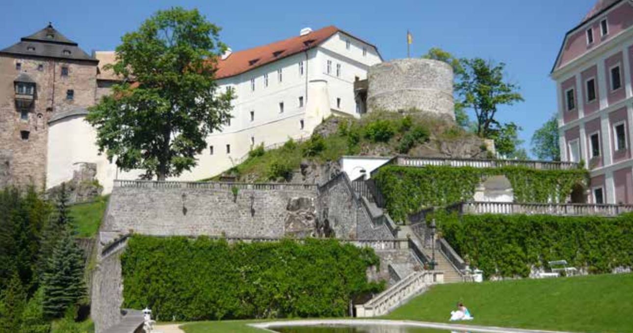
Hrad a zámek Becov, foto: L. Zoubek