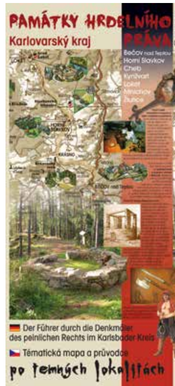
Obálka unikátního mapového průvodce