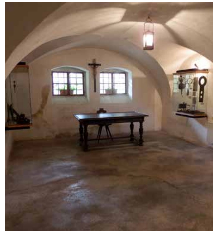
Muzeum ve Žluticích