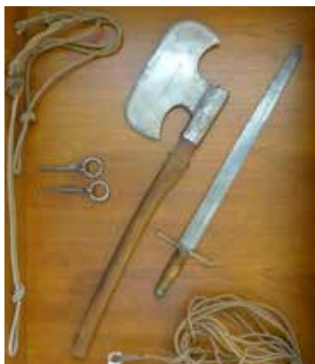
Originální nástroje kata Hussa na zámku Kynžvart

Zámek je dnes známý především jako klasicistní sídlo rodu Metternichů. Nabízí možnost obdivovat rozsáhlý anglický park či unikátní interiéry obsahující nejenom do-