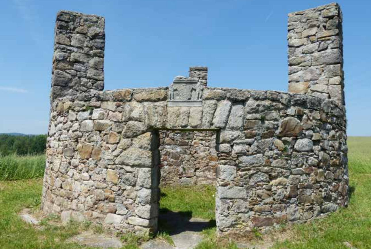
Zbytky šibenice v Horním Slavkově