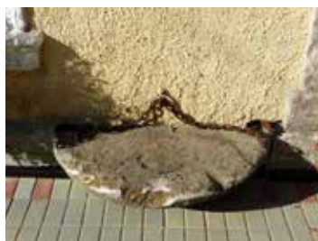
Dochovaný relikt pranýře v Mnichově

Mnichov poprvé zmíněn r. 1273, od 15. století městečko, v 16. století prosperovalo díky těžbě stříbra a cínu, v 19. stol. pak přešlo na těžbu hadce a jeho zpracování. Na protáhlém náměstí barokní kostel sv. Petra a Pavla z let 1719-1725, obnovovaný v letech 1860 a 1905. Na budově patrové barokní radnice jsou zachovány vlevo od hlavního vchodu zbytky pranýře s replikou okovů.