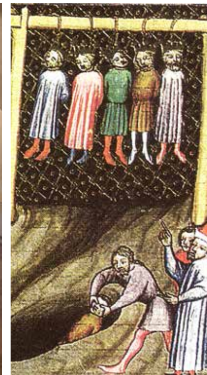
Ukázka pohřbívání pod šibenicí