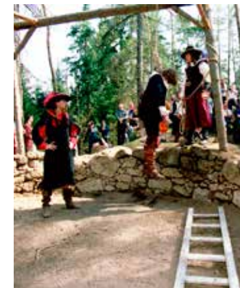
Bečov nad Teplou: Slavnostní otevření NS v roce 2003

Na mírně vyvýšeném místě nad Horním Slavkovem, zvaném Šibeniční pole, dosud stojí nejzachovalější zbytky šibenice v ČR. Slavkovská šibenice byla přestavěna na kamennou v 16. století. V 19. století prošlo popraviště romantickou úpravou a v roce 1936 prodělalo výrazný rekonstrukční zákrok, díky kterému je snadné si tento typ popraviště představit v jeho celistvosti. Šibenice je zapsána v Ústředním seznamu kulturních památek ČR. Přímo u šibenice je vytvořeno parkoviště, takže se k památce lehce dostanou i vozíčkáři či rodiny s dětmi.