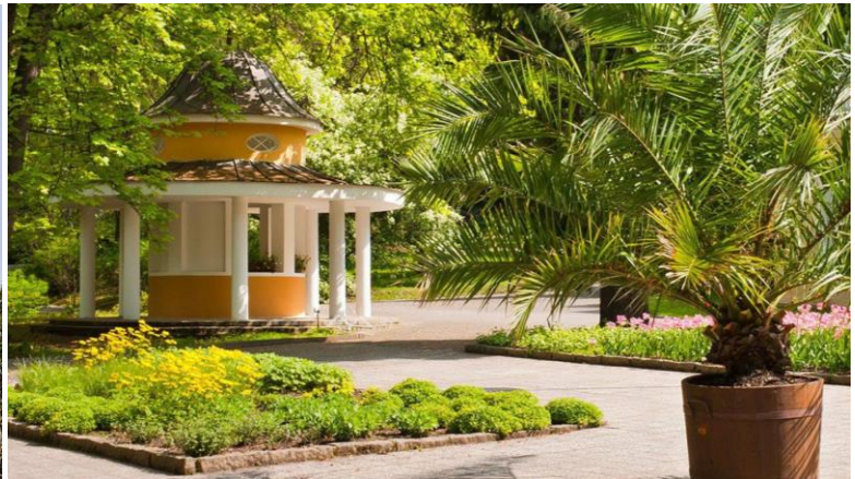
Prusikův pramen – obsahuje nejvyšší množství oxidu uhličitého v celé ČR