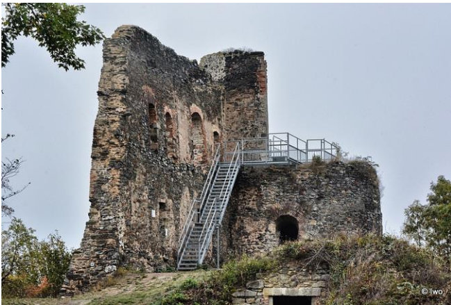
Zřícenina hradu Krasíkov s vyhlídkovou plošinou