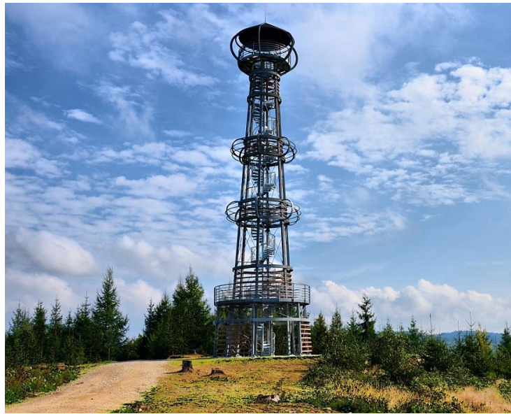
Rozhledna Cibulka nad Olovím