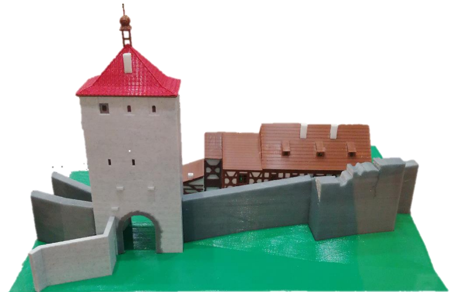
Modell des Mühltors vor dem Jahre 1839 in der Ausstellung Tore und Befestigungsanlagen der Stadt Eger