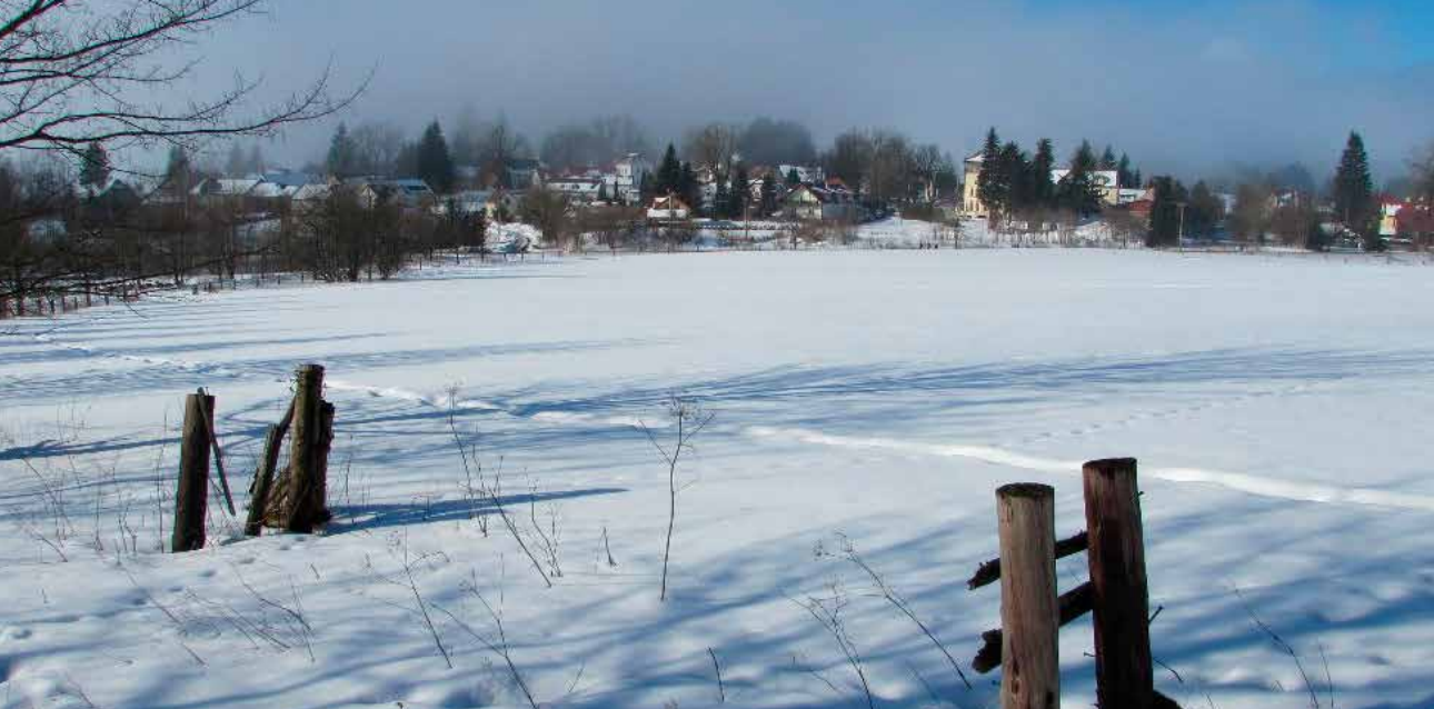
Závišín - jedno z možných výchozích míst