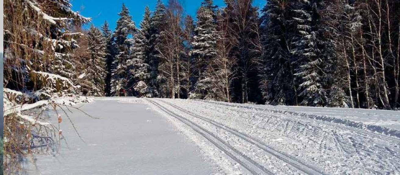
Strojově upravené trasy v prostoru areálu Golf Resort Karlovy Vary

Odkaz na Mapy.cz: https://mapy.cz/s/2lmX6