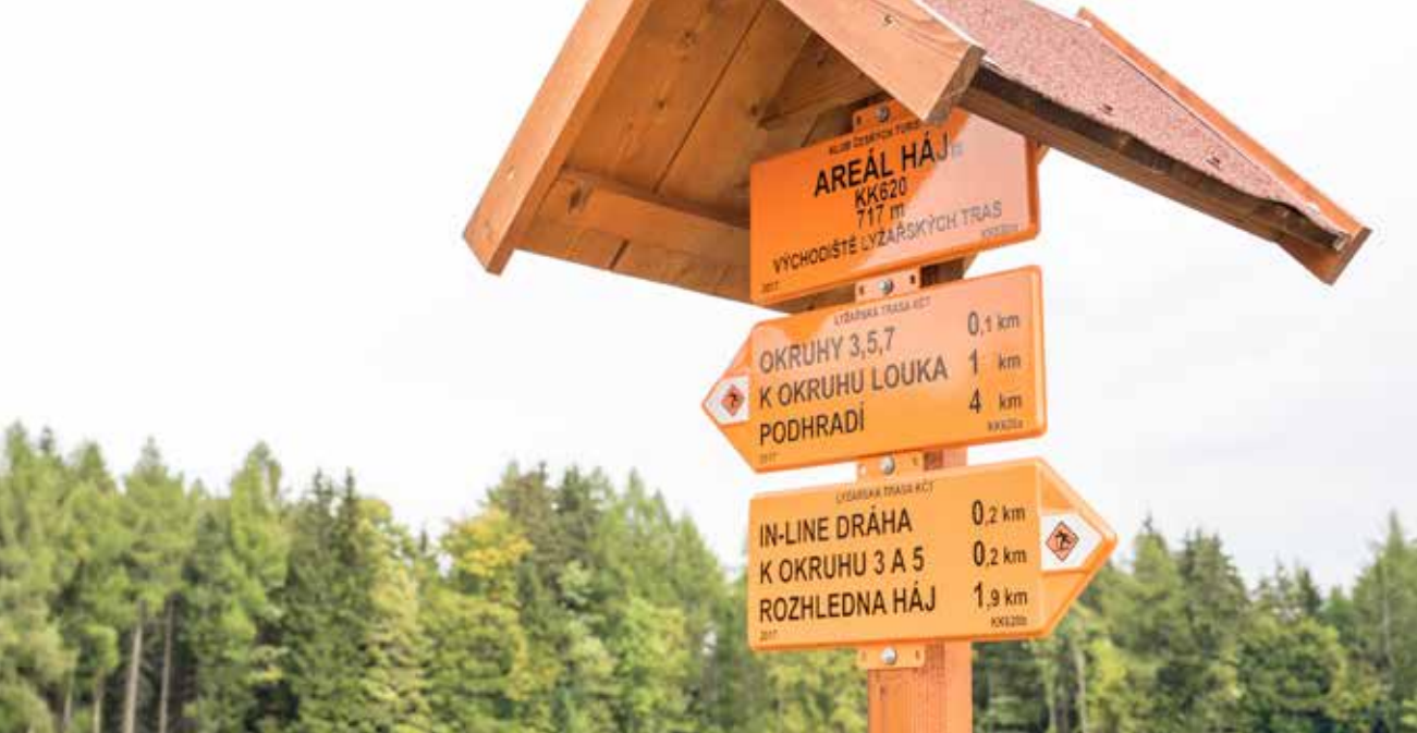
Běžkařské okruhy kolem vrchu Háje u Aše mají celkem 17 km