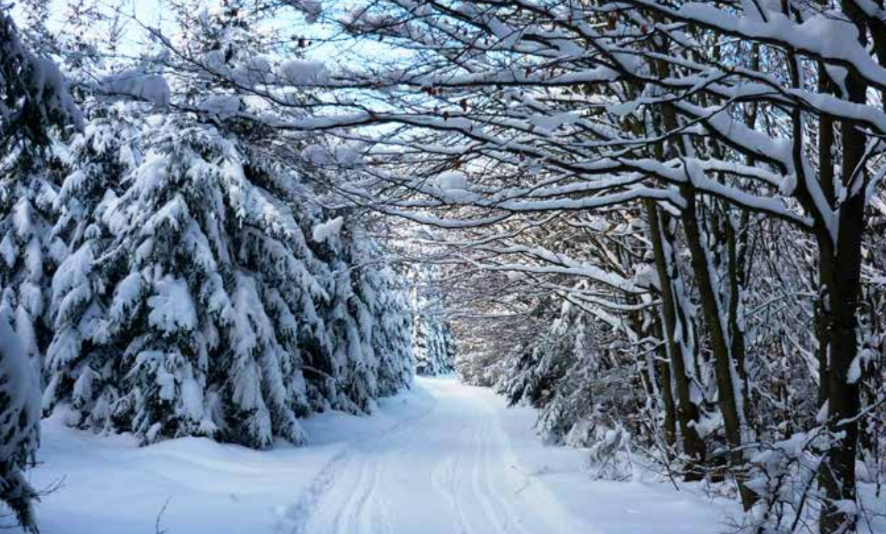
Krušnohorská lyžařská magistrála byla tématem časopisu Turista 1-2/2018, v tomto čísle se proto známé hřebenovce vyhneme