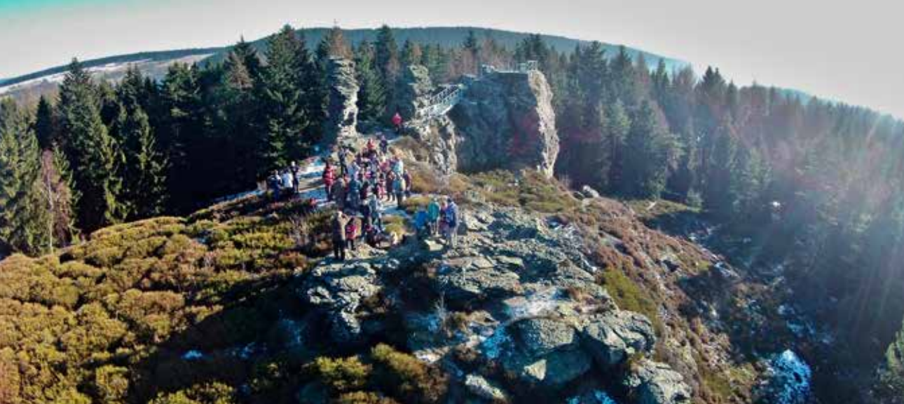
Přírodní památka Vysoký kámen