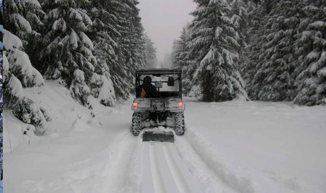
O údržbu běžkařských stop pod Dyleň pečuje spolek Život na Dyleň

úpravu zimních běžeckých tras Karlovarský kraj podporuje ty, kdo se o bílé stopy starají, i nás - uživatele jejich práce a úsilí. Věřím, že to oceníte i vy.