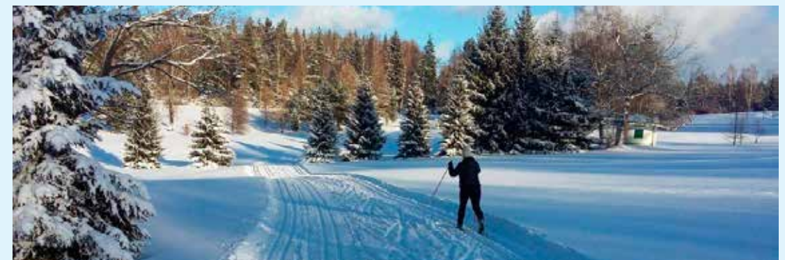
Využít zde můžete dva okruhy (s délkou 3,3 km a 3,1 km)

Odkaz na Mapy.cz: https://mapy.cz/s/2ln1Q