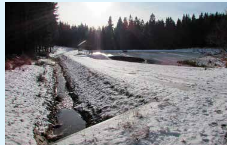
Kyselé jezero u Kladské