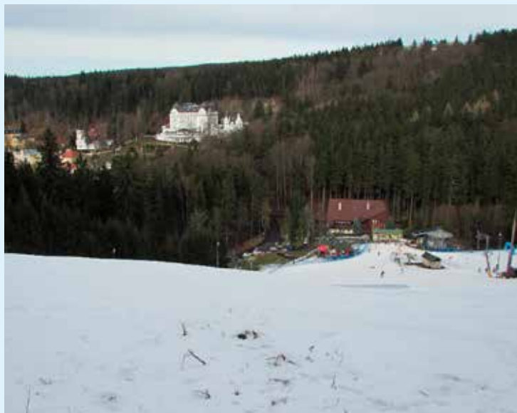
Sjezdovka ve skiareálu Mariánky

Zázemí si můžete udělat třeba v hotelu Krakonoš (755 m), kde nám turistům i turistice fandí. Odtud už je jen 1,5 km do areálu golfového hřiště Royal Golf Club Mariánské Lázně (740 m), které je v zimním období jednou ze vstupních bran pro běžecké lyžování. Pro jednodenní výlet můžete použít i parkoviště v Závišíně (730 m), cca o 2 km dále ve směru na Teplou. Oblíbené výchozí místo je také parkoviště Kladská (820 m). Do Kladské doporučuji v zimě použít silnici od Lázní Kynžvart a nejezdit přímo přes les z Mariánských Lázní (tato silnice je totiž obtížně sjízdná a jezdí se tu kyvadlově). Více běžkařů potkáte spíše v okrajových částech, hlouběji do centra Slavkovského lesa