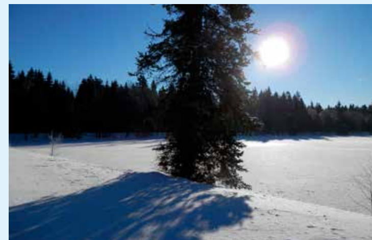
Vaším cílem se v okolí Kladské může stát třeba i Mýtský rybník