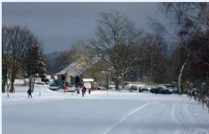
Nástupní místo s parkovištěm v osadě Lobzy

Od řeky Ohře se svahy prudce zvedají vzhůru. Ze Sokolova se autem po necelých 10 km jízdy dostanete do osad Kamenice a Lobzy, které patří katastrálně k městu Březová. A právě město Březová už řadu let financuje víkendovou úpravu běžeckých stop v této severní části Slavkovského lesa. Sněhové podmínky jsou během posledních zim trochu jako na houpačce, ale o sněžný skútr a úpravu stop se stará běžkař tělem i duší. Pokud je sněhová pokrývka dostatečně vysoká, stopy se zpravidla upravují v sobotu a v neděli brzo ráno.