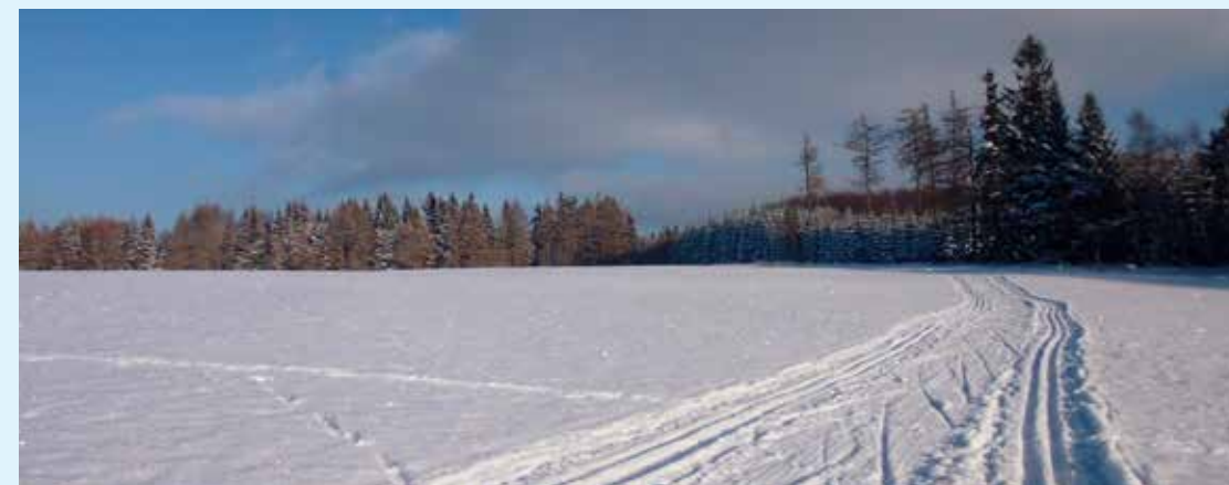
Provozovatelem Ski Březová je město Březová

Základní okruh měří 10 km, z něho však odbočuje dalších šest kratších. Celková délka upravovaných stop za ideálních sněhových podmínek je téměř 25 km.