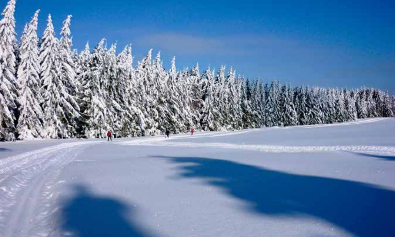
Za ideálních sněhových podmínek zde činí celková délka upravovaných stop téměř 25 km