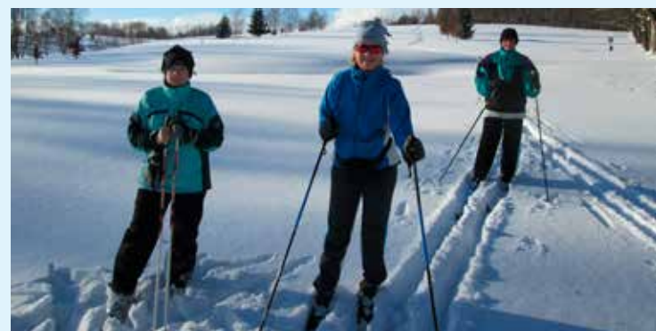
Město Luby sousedí s přírodním parkem Kamenné vrchy, zdejší příroda je i v zimě velmi podmanivá

měrou podílí na strojově upravených zimních běžeckých tras. Klub českých turistů v této lokalitě eviduje a udržuje zimní značení na 33 km lyžařských běžeckých tras. Pro běžkaře je také zajímavá cesta, která za Vysokým kamenem pokračuje od rozcestí Kegelberg/Kuželka směrem na Kraslice. Pro zimní běžecké lyžování využívá červenou pěší turistickou značenou trasu, jen závěrečný sjezd je veden do lyžařského areálu Skalka. Vlakem se z Lubů dostanete do Chebu, odkud můžete využít další přípoje.