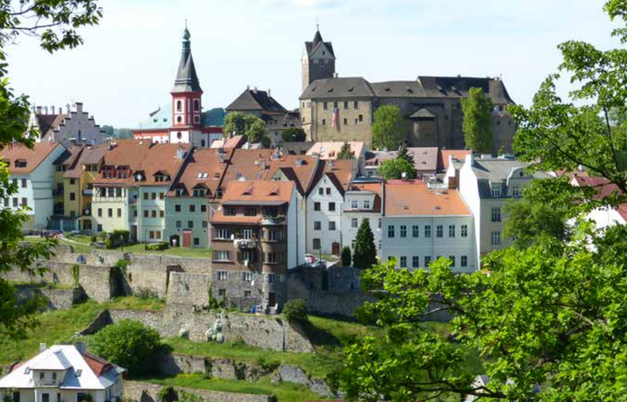
Dominantou města Loket je středověký hrad a kostel sv. Václava