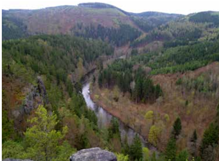
Údolí Ohře ze skalní vyhlídky nad Vildenavou, 3 km za Loktem po proudu řeky

Na cestu do Lokte a jeho okolí (nejen za svatými obrázky) vám dají dobré rady také pořadatelé XVI. Letního turistického srazu Sokolov 2018, a to během hlavních srazových dnů od 4. do 8. července 2018. Registrační formulář a potřebné informace o srazu najdete na http://www.kctkv.cz/letnistras2018/ . Nezapomeňte se včas přihlásit! Registrace končí již 31. května!