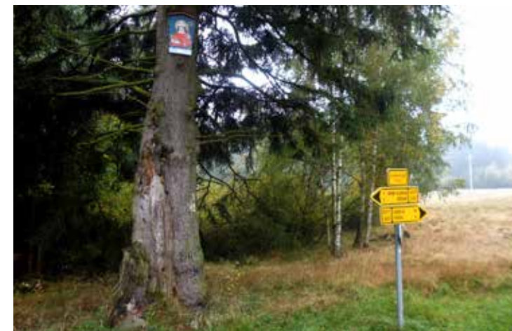
Jedním ze svatých, jejichž obrázek můžete při putování okolím Lokte potkat, je sv. Mikuláš

Další pozvánku na cestu představuje 12 obrázků svatých patronů, které jsou rozvěšeny v okolí Lokte. Obnovit dávnou tradici obrázků svatých na cestách se rozhodli místní patrioti z výtvarné skupiny Essence a - nutno přiznat - povedlo se jim to znamenitě. Je však škoda, že kromě tří informačních tabulí (u benzínové stanice, u školy a na odbočce ke Kamenitému, resp. Supímu potoku) není o obrázcích mnoho informací. I přesto je však při vycházce po lesních cestách směrem do Dvorů a k Nadlesí, ke kostelu sv. Mikuláše nebo na Krudum snadno najdete. Jako šikovný průvodce se vám pak na cestu loketskými