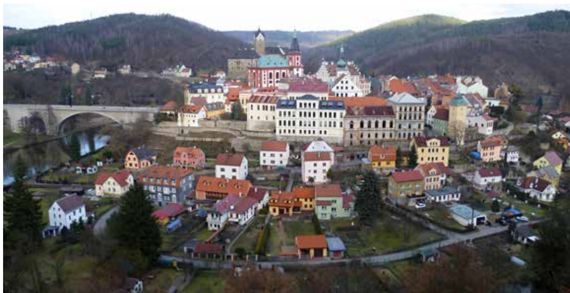
Výhled na město je z okolních svahů skutečně působivý

se můžete vydat na vycházku ke smírčím křížům nad městským hřbitovem v severozápadní části města. Přímo na hřbitově je k vidění zajímavý pomník obětem války v roce 1866 a také náhrobek Josefa Cinibulka, který dne 29. října 1923 pilotoval let Bratislava–Praha, označovaný jako první poštovní let mezi těmito městy. Jste-li více