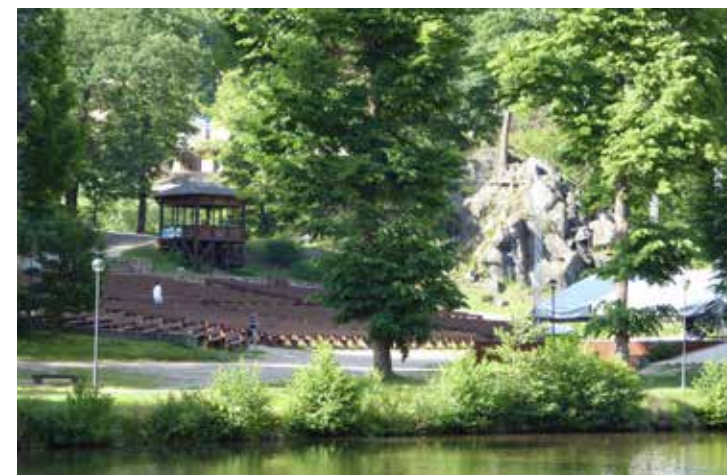
Loketský přírodní amfiteátr

Jako místo oběda se nabízí například pivovar Ferdinand, kde si jako bonus můžete prohlédnout expozici věnovanou historii zdejšího pivovarnictví. Snad nejlépe vám pak vytráví při fotografování hradních kulís z lodičky, kterou na řece Ohři (v přístavišti pod obloukovým mostem) provozují Autobusy Karlovy Vary, a.s. Anebo